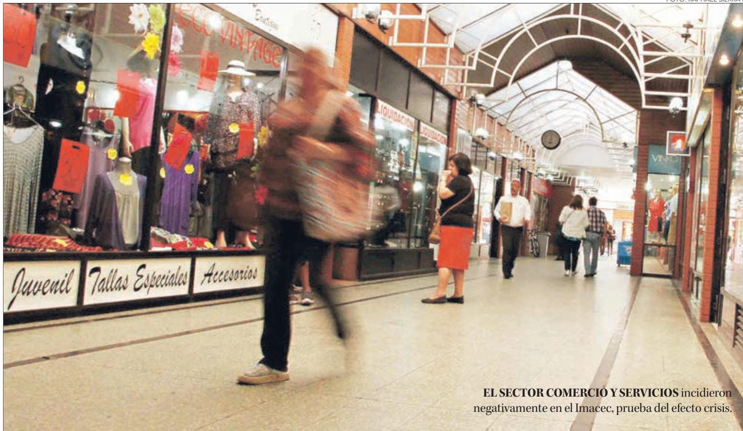
EL SECTOR COMERCIO Y SERVICIOS incidieron negativamente en el Imacec, prueba del efecto crisis.

Desde Santander puntualizaron que los datos preliminares de noviembre (generación eléctrica cerró en -0,1% versus -1,6%, en octubre, y el comercio exterior a la tercera semana muestra una contracción algo menor al mes anterior), permiten prever una recuperación en el margen, con un Imacec que se ubicaría entre -1,5% y -2%. “Esto resulta coherente con un rebote en algunos servicios que se