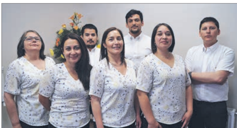
INTEGRANTES DEL EQUIPO de Formación Permanente.