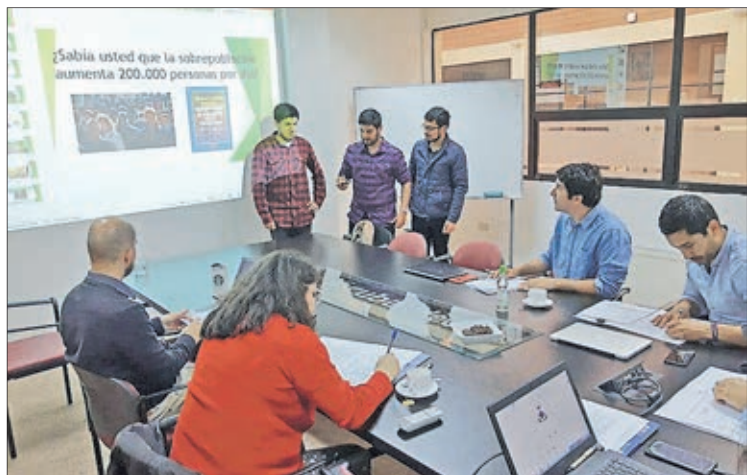
ECONOMÍA circular es uno de los tracks finalistas del desafío.