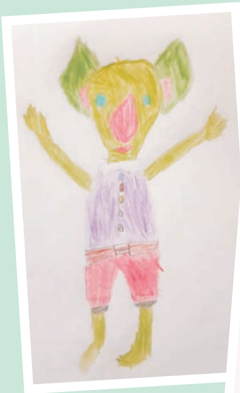
Duende de los mares. Cristóbal Azocar