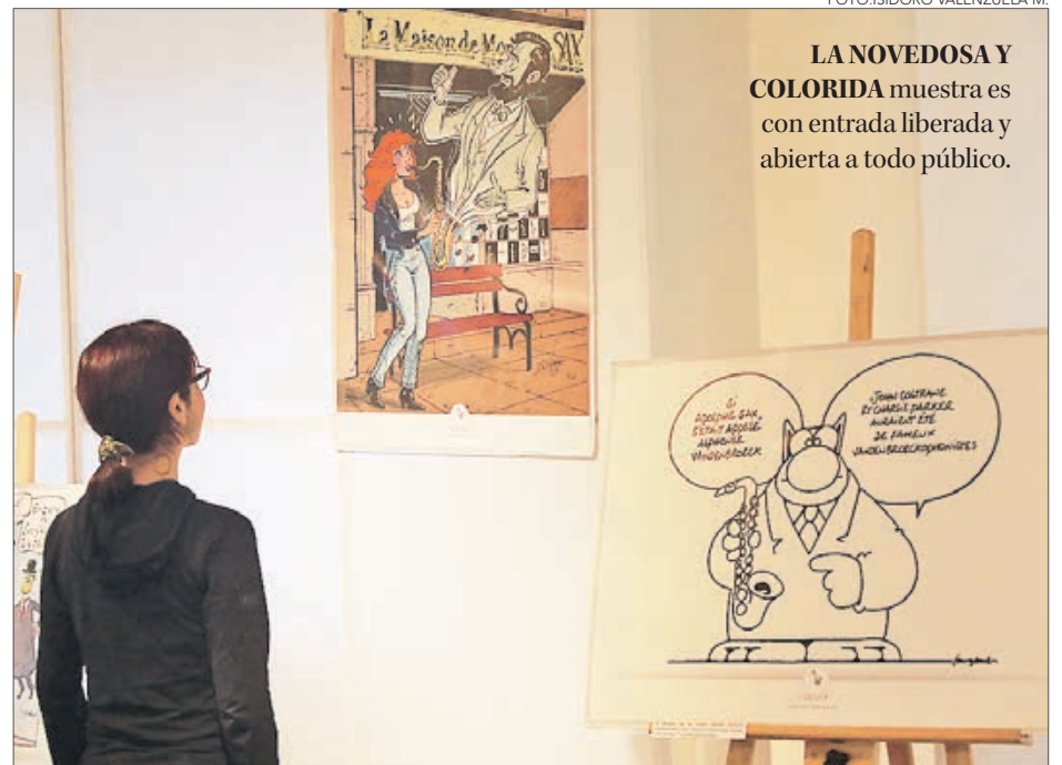
LA NOVEDOSA Y COLORIDA muestra es con entrada liberada y abierta a todo público.

puntual en el año 1920 con la aparición del género musical del jazz.