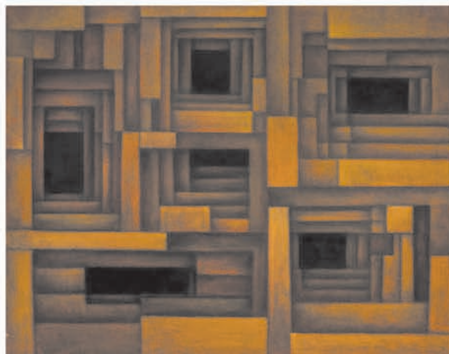
Laberinto, Eduardo Meissner

cios con sus propias lógicas. De algún modo el espacio del arte es una heteretopía donde Meissner es el pirata que gobierna la balsa de la medusa, en la Escuela de Arte de la Universidad de Concepción.