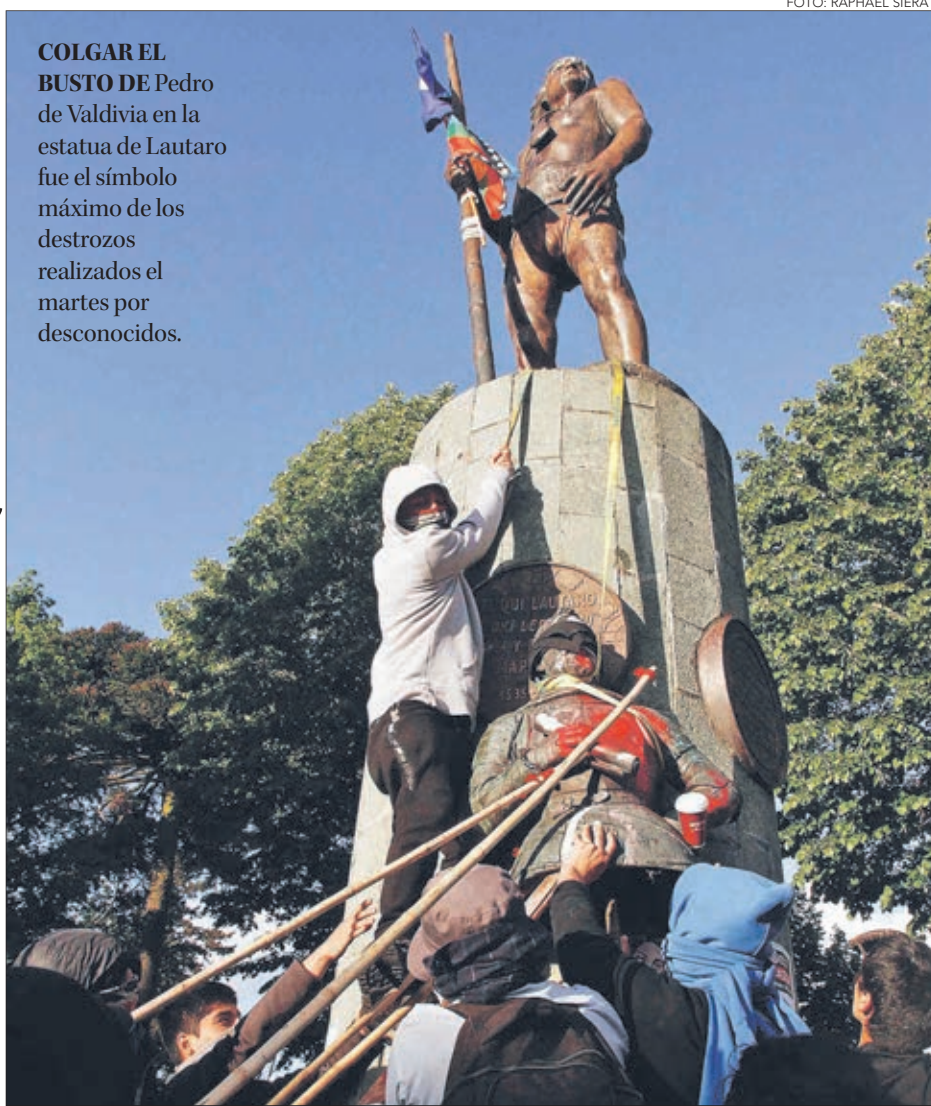
COLGAR EL BUSTO DE Pedro de Valdivia en la estatua de Lautaro fue el símbolo máximo de los destrozos realizados el martes por desconocidos.

Twitter @DiarioConce contacto@diarioconcepcion.cl