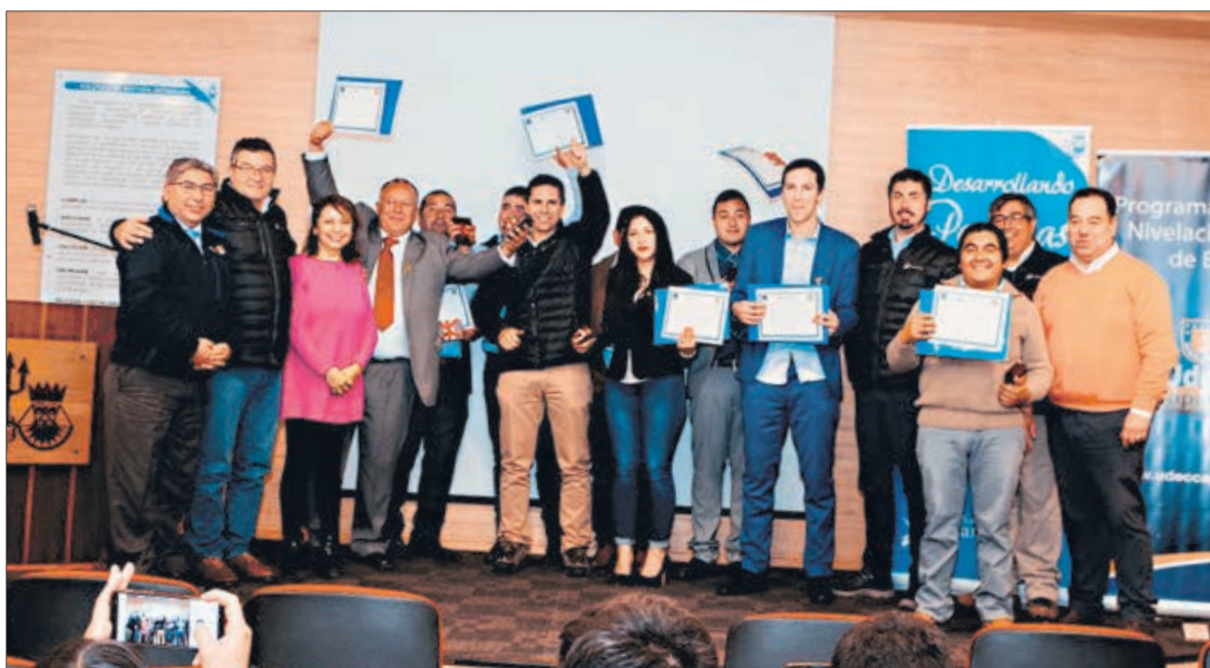
ALUMNOS SEGUNDO NIVEL.

UdeC Capacita tuvo la responsabilidad de apoyar el proceso de aprendizaje de 8 trabajadores que aceptaron el desafío de terminar su enseñanza media, para ello se instaló dicho Programa en la empresa durante el período de Marzo a Junio de 2019. El Programa destaca la participación de Profesores con experiencia en la Enseñanza de Adultos bajo el enfoque andragógico.