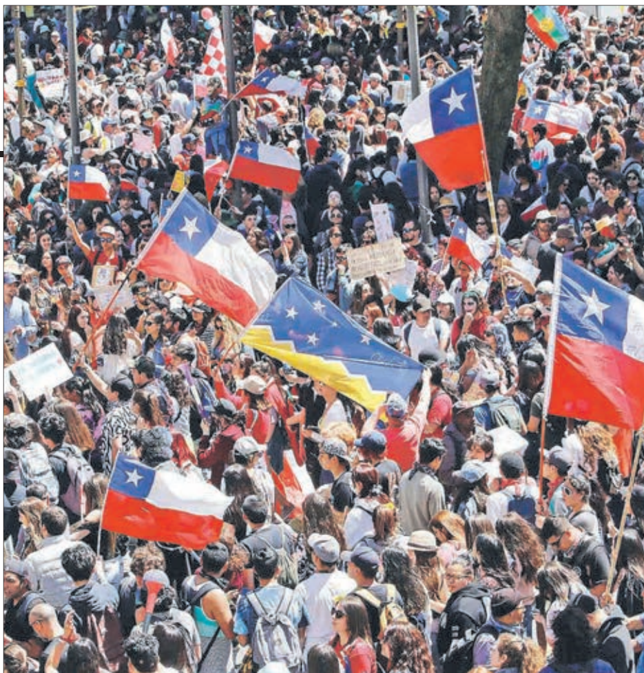
UNAS 30 MIL PERSONAS marcharon ayer en forma pacífica por calle O'Higgins pidiendo mayores reformas sociales.

destacados de la jornada fue la aprobación la idea de legislar la iniciativa que disminuye la jornada laboral en 40 horas, con el apoyo de 88 diputados (24 votaron en contra y hubo 27 abstenciones).