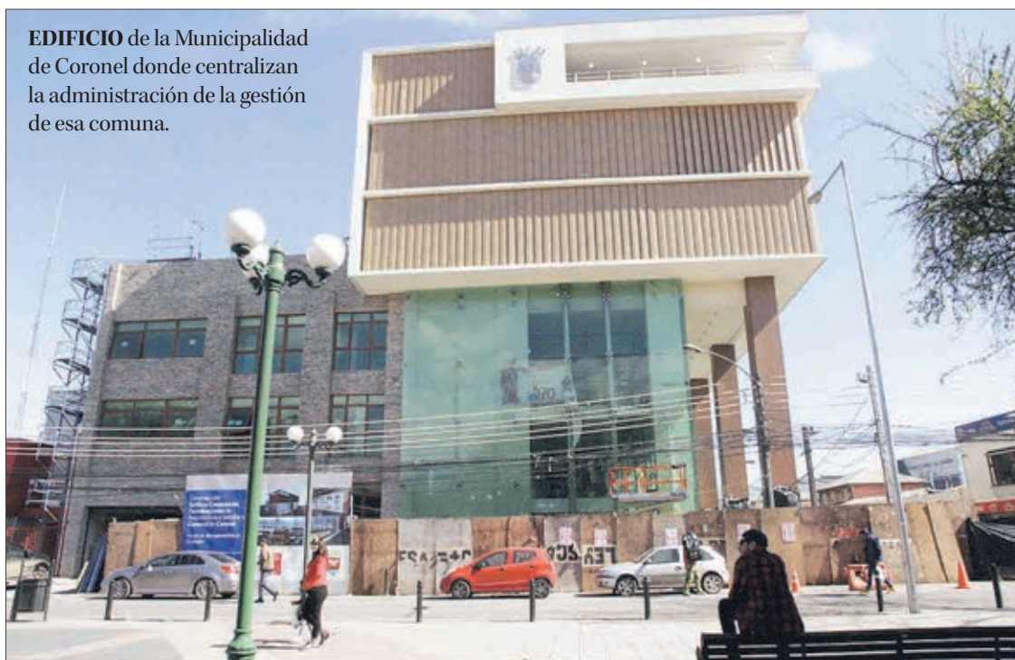
EDIFICIO de la Municipalidad de Coronel donde centralizan la administración de la gestión de esa comuna.

CENTRO DE ESTUDIOS ANALIZA LA GESTIÓN MUNICIPAL REGIONAL ACTUAL