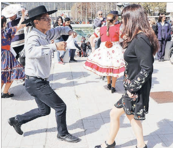
EL HITO REUNIÓ a cientos de personas amantes del folclor nacional.