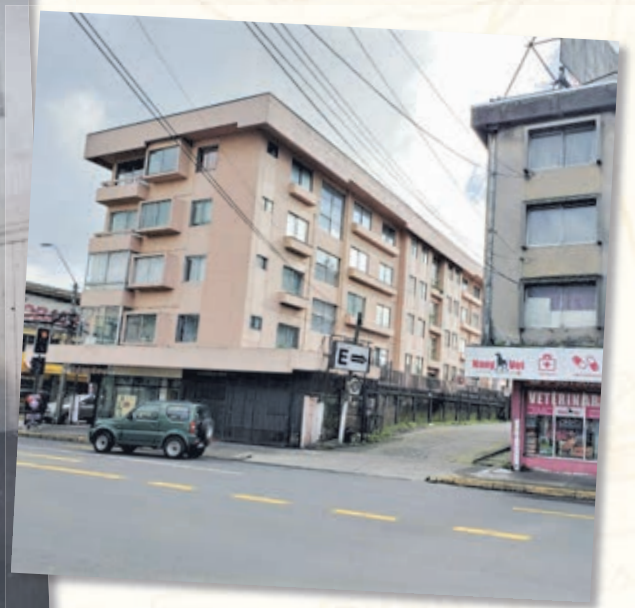
LUGAR donde estuvo la casa natal de Pepo.