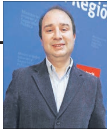
Alejandro Guillier, senador de la región de Antofagasta.

“Chile está a años de luz de tener un mercado laboral que enfrente esta realidad. Además, tenemos un sistema de capacitación muy deficiente”.