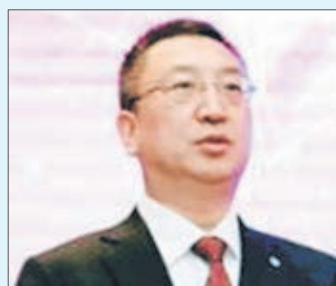
JEFE ECONOMISTA del Ministerio de Industria e Información Tecnológica de la República Popular de China, Wang Xinzhe.

des y foros realizados durante la semana, en especial el trabajo realizado en el marco del SME Working Group. Además, presentan iniciativas, proyectos y programas, tanto a nivel nacional como dentro de la región Apec, que permitan el desarrollo de las pequeñas y medianas empresas", detallaron.