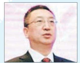
JEFE ECONOMISTA del Ministerio de Industria e Información Tecnológica de la República Popular de China, Wang Xinzhe.