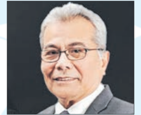
MINISTRO de Desarrollo y Emprendimiento de Malasia, Hon. YB Datuk Seri Mohd Redzuan Yusof.