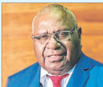
MINISTRO de Comercio e Industria de Papúa Nueva Guinea, Hon Wera Mori.