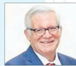
SUBSECRETARIO de Comercio Internacional de Estados Unidos, Gilbert Kaplan.