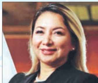
MINISTRA de Producción de Perú, Rocío Ingred Barrios.