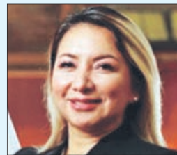
MINISTRA de Producción de Perú, Rocío Ingrid Barrios.