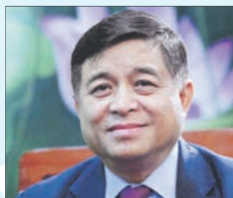
MINISTRO de Planificación e Inversión de Vietnam, Nguyen Chi Dung.

El ministro de Economía, Juan Andrés Fontaine, será el anfitrión, quien moderará tres debates, junto con sus pares de Vietnam, Papúa Nueva Guinea, Malasia y Perú: la digitalización de las Pymes, la internacionalización y el financiamiento.