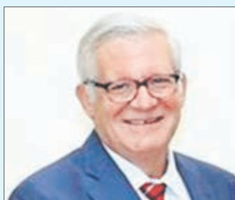
SUBSECRETARIO de Comercio Internacional de Estados Unidos, Gilbert Kaplan.