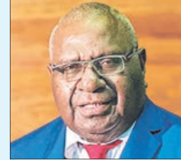
MINISTRO de Comercio e Industria de Papúa Nueva Guinea, Hon Wera Mori.