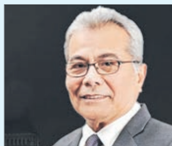
MINISTRO de Desarrollo y Emprendimiento de Malasia, Hon. YB Datuk Seri Mohd Redzuan Yusof.