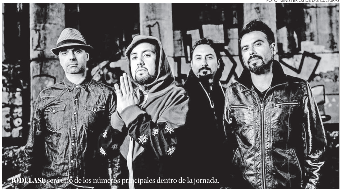
JODELASE será uno de los números principales dentro de la jornada.

nueva versión del Día de la Música y los Músicos Chilenos contará, durante toda el transcurso, con un traductor simultáneo en lengua de señas, esto con el objetivo de ampliar