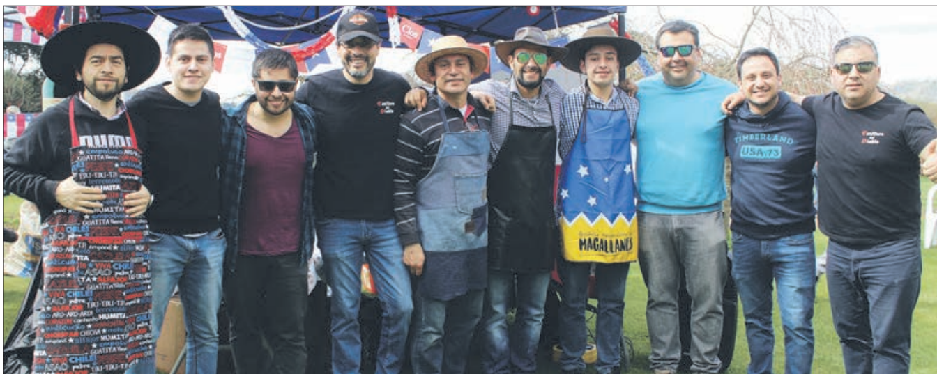
RAMA DE VOLEYBALL DEL CLUB DE CAMPO BELLAVISTA.