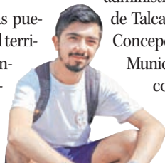
table y de forma que cada habitante de la gran urbe en que vivimos pueda también utilizar un pedazo de ella para esa cosa tan importante llamada "ocio".

Todas las interrogantes mencionadas pueden tener respuesta sólo si los actores del territorio son articulados y avanzan en conjunto en una plan para hacer de esta península un gran espacio de protección a la biodiversidad, con un turismo susten-