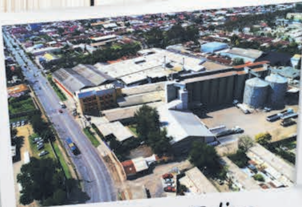
Planta San Felipe