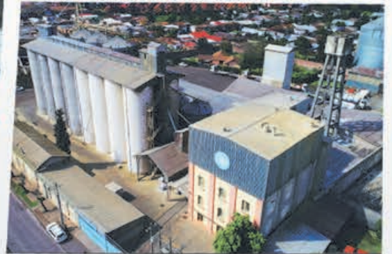
Planta San Fernando