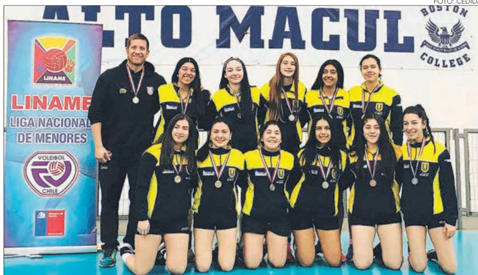
CAMPANIL SE QUEDÓ CON SEGUNDO LUGAR EN SERIE B

Twitter @DiarioConce contacto@diarioconcepcion.cl