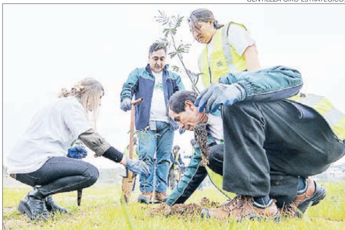
GENTILEZA GIRO ESTRATÉGICO.