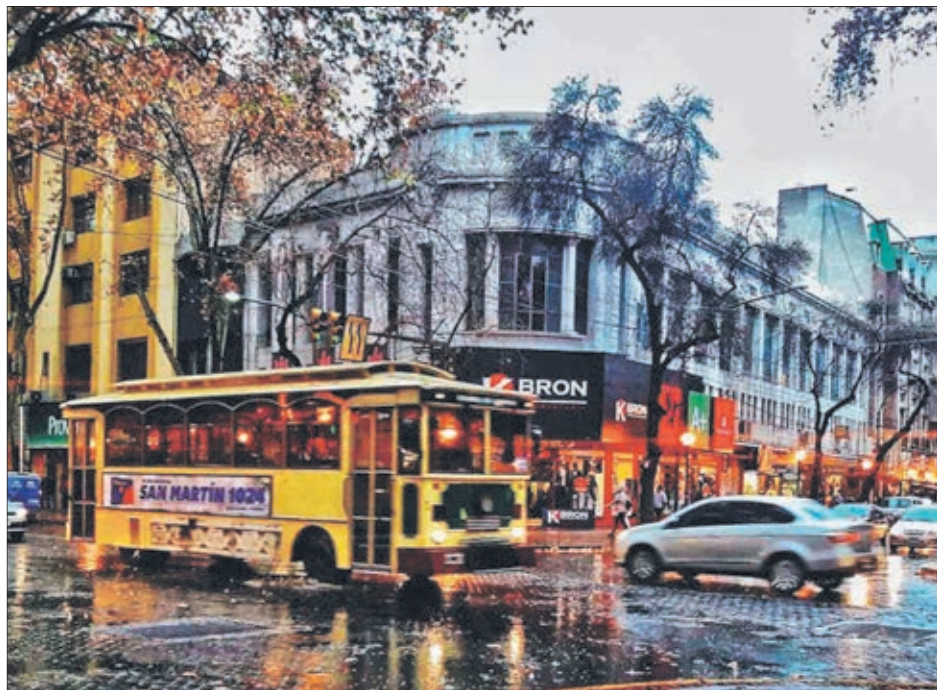
MENDOZA es capital de Provincia, la cual tiene una importante actividad económica. San Rafael, por ejemplo, se caracteriza por su desarrollado sector vitivinícola.