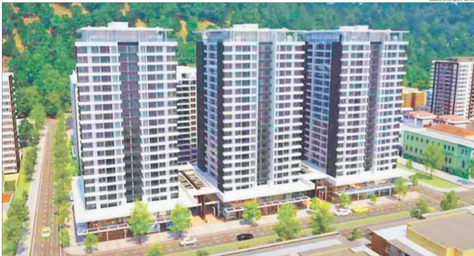
IMAGEN RENDER AITUE

Concluyó diciendo que "esta es una lucha abierta de toda la comunidad, no sólo de los recursos que han presentado los recurrentes del Liceo Charles de Gaulle o nosotros, sino de toda la comunidad penquista que van a ver afectada su calidad de vida".