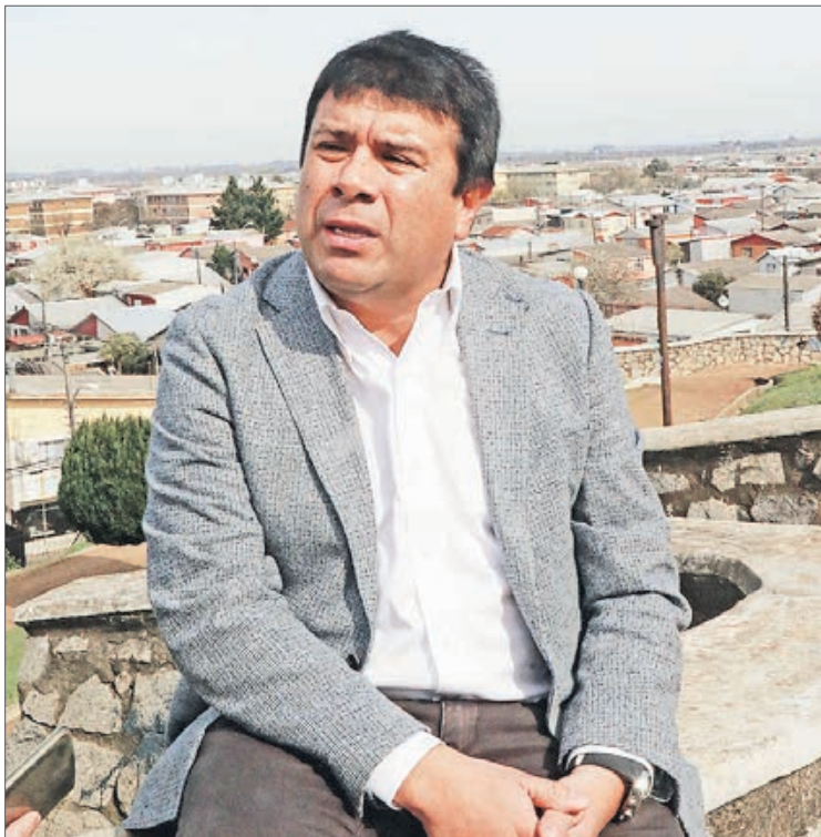
CAMPOS es crítico de las "actitudes bochornosas" del Concejo Municipal.