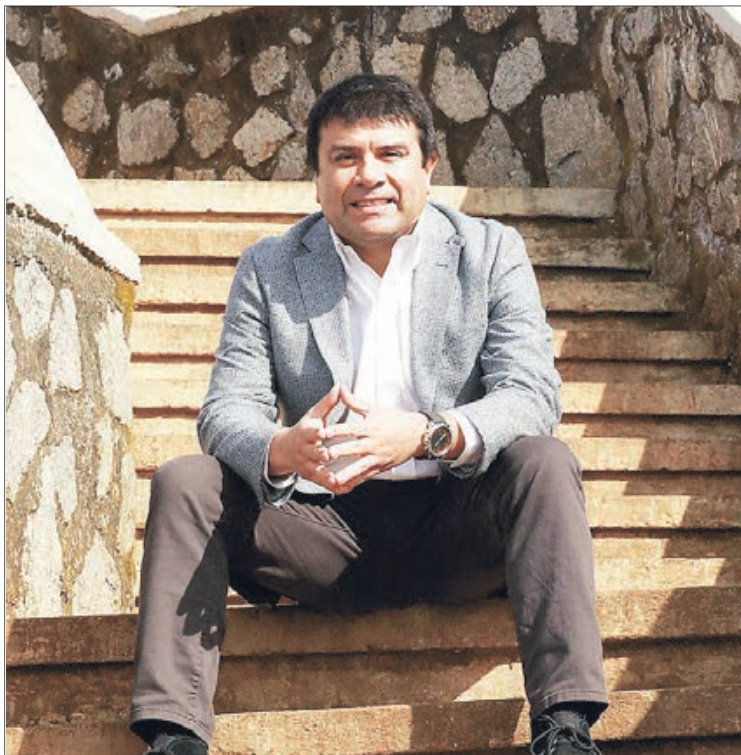
EL CONGRESO, dijo, es una etapa cerrada.

- Cuando uno está en un cargo, debe tener un sentido de responsabilidad. Es una oportunidad preciosa para poder dirigir una comuna de 120 mil habitantes, donde se pueden proyectar un conjunto de fortalezas que están dadas en la comunidad, que además quiere seguridad, empleo e inversión pública. Por eso, va evaluando sus autoridades. En el último tiempo estas rencillas y debates, un poco temas de fondo y un poco temas personales, creo que a la gente le ha generado un detrimento en la calidad de vida. A nadie le gusta vivir en una comuna donde se habla de descalificaciones personales en un matinal. Es muy relevante que cada uno vaya asumiendo sus responsabilidades. A la alcaldesa le queda un año de gestión y uno esperaría que al dirigir la comuna lo haga con responsabilidad. Fui uno de los que creyó que estos cuatro años iban a ser de éxito para la comuna, donde se iban a cerrar etapas, donde hubiera buena convivencia, pero ha habido