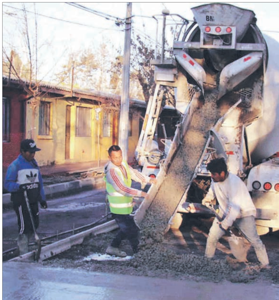
PARA POSTULAR, los vecinos deberán constituir un comité de pavimentación, reunir y acreditar el ahorro mínimo, contar con un proyecto de ingeniería aprobado por el Serviu.

Twitter @DiarioConce contacto@diarioconcepcion.cl