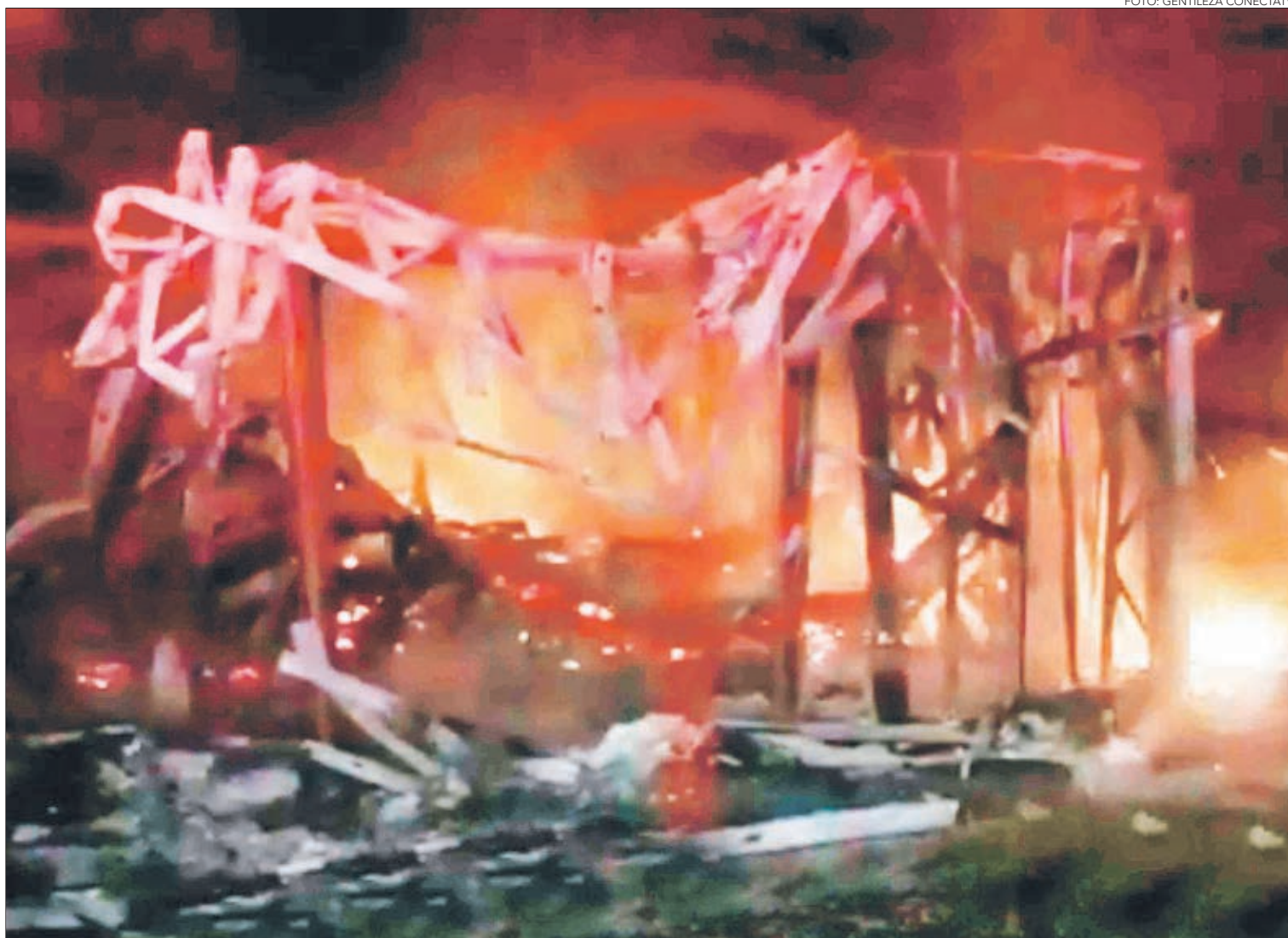
ASÍ QUEDARON LAS INSTALACIONES atacadas en Puerto Peleco.

La acción legal fue interpuesta por las omisiones ilegales y arbitrarias relativas a sus obligaciones sobre orden, seguridad y tranquilidad pública.