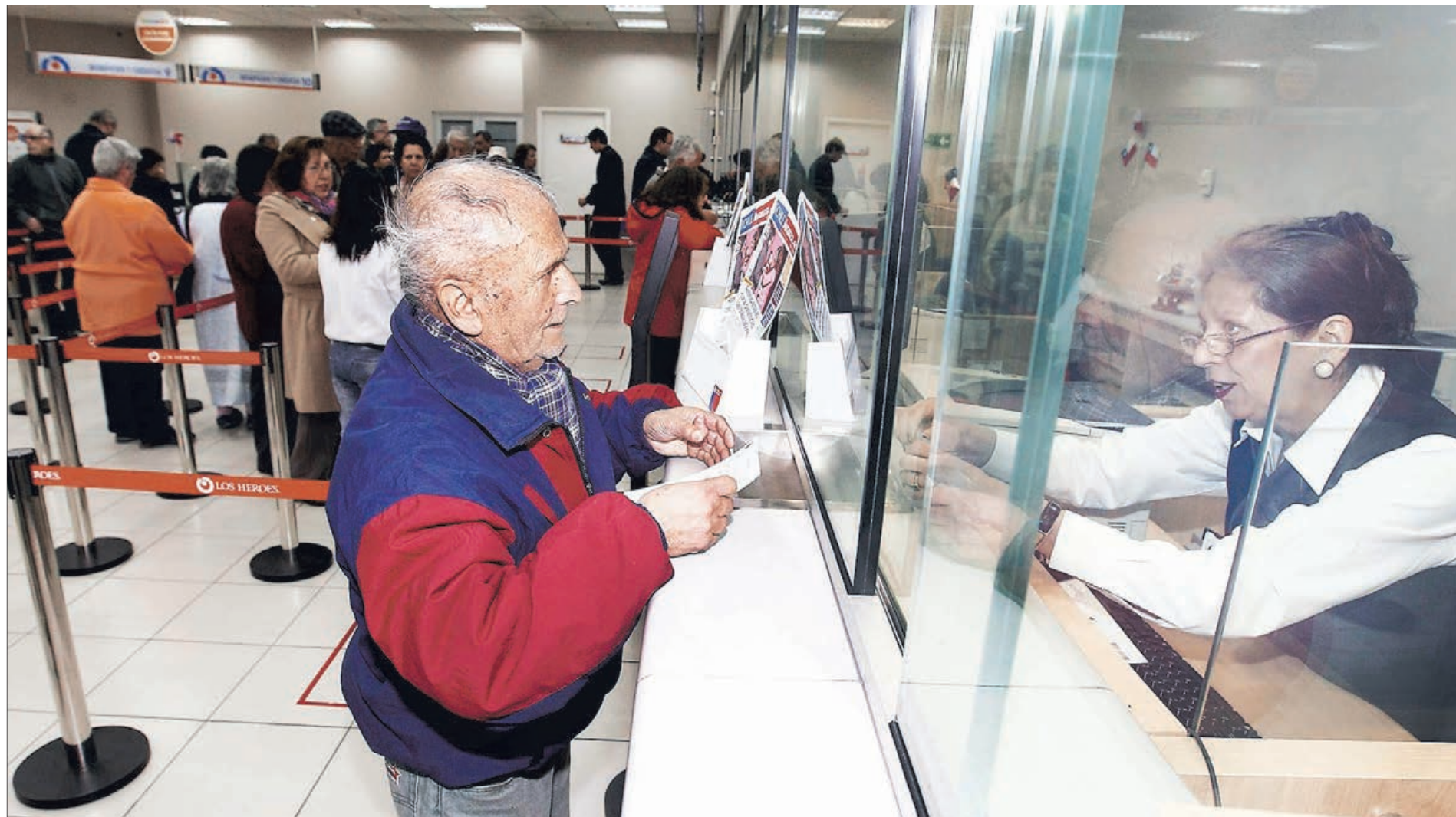
SE ENTREGARÁ DE MANERA AUTOMÁTICA EN LA MENSUALIDAD DE AGOSTO