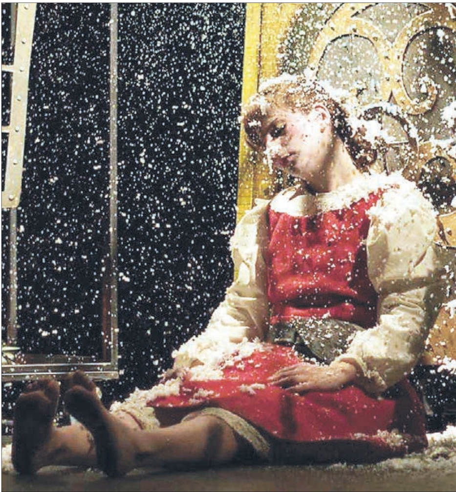
EL AÑO PASADO, EL COLECTIVO volvió a poner en escena, con apoyo del Fondart, la obra con la cual partieron su camino teatral.