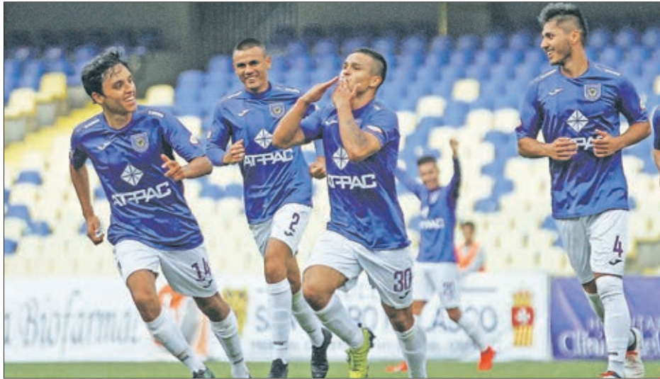
D. CONCEPCIÓN VISITA LOS ANDES, A LAS 15 HORAS