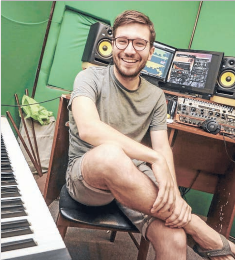
VIDAL NO DESCARTA volver a Concepción para compartir su experiencia en el área.

Mauricio Maldonado Quilodrán contacto@diarioconcepcion.cl