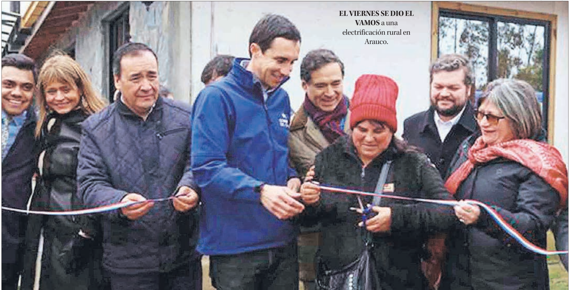
EL VIERNES SE DIO EL VAMOS a una electrificación rural en Arauco.

MINISTRO DE ENERGÍA, JUAN CARLOS JOBET, INFORMÓ DE $7 MIL MILLONES PARA DAR SOLUCIONES