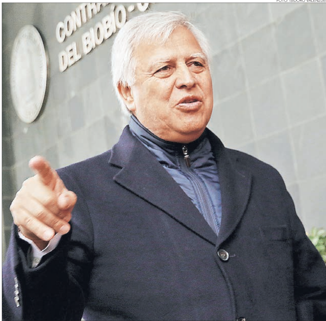
GASTÓN SAAVEDRA, DIPUTADO, EX PRESIDENTE DE LA COMISIÓN DE TRABAJO:

“En el país el 42,2% del empleo actual está amenazado con desaparecer producto de la automatización”