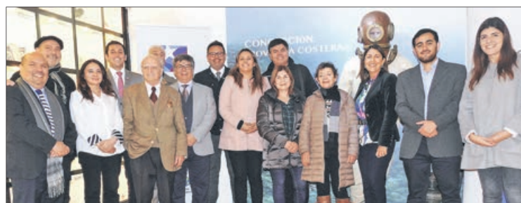
EL LANZAMIENTO SE REALIZÓ EN EL SALÓN de cerámica patrimonial del Museo de la Historia de Concepción.