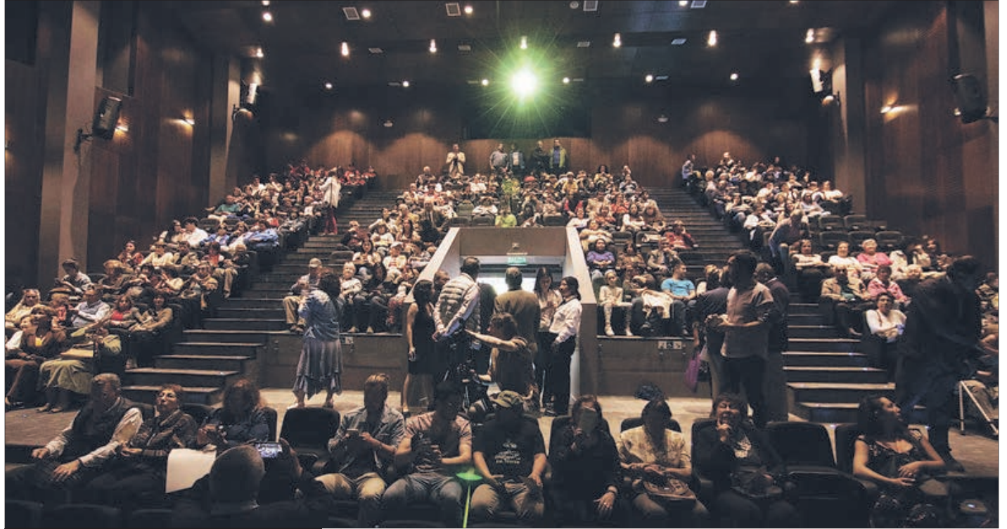
SALA DE LAS ARTES ESCÉNICAS

“El espacio es amplio y nos permite recibir distintos tipos de actividades. Hemos recibido a compañías y agrupaciones de Chiguayante, y también de otras comunas quienes realizan sus obras o utilizan la sala para ensayar sus obras. Por ejemplo, estuvimos trabajando con Artefacto Imaginario, grupo conformado