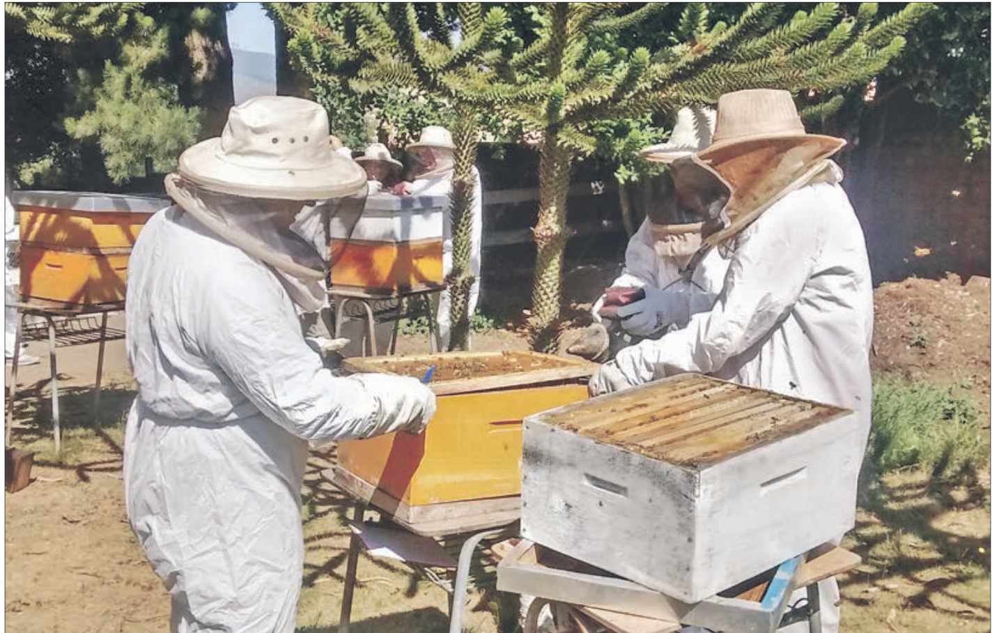
UNA NUEVA BETA DE DESARROLLO COMUNAL

“Nos hemos transformado en un referente nacional en materia de apicultura urbana. Tenemos muchos apicultores y hay otros que aún no se han dado a conocer porque no existen normativas vigentes”, comentó.