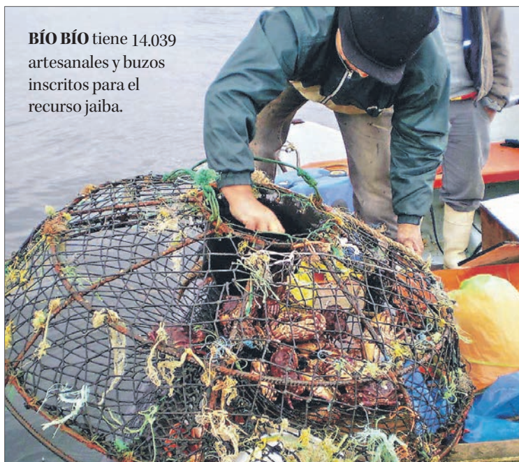
BÍO BÍO tiene 14.039 artesanales y buzos inscritos para el recurso jaiba.

Más adelante, en la parte resolutoria, se lee: "Suspendase por el término de cinco años (...) la inscripción en el registro artesanal de la pesquería de la jaiba marmola (...) desde la Región de Arica y Parina-