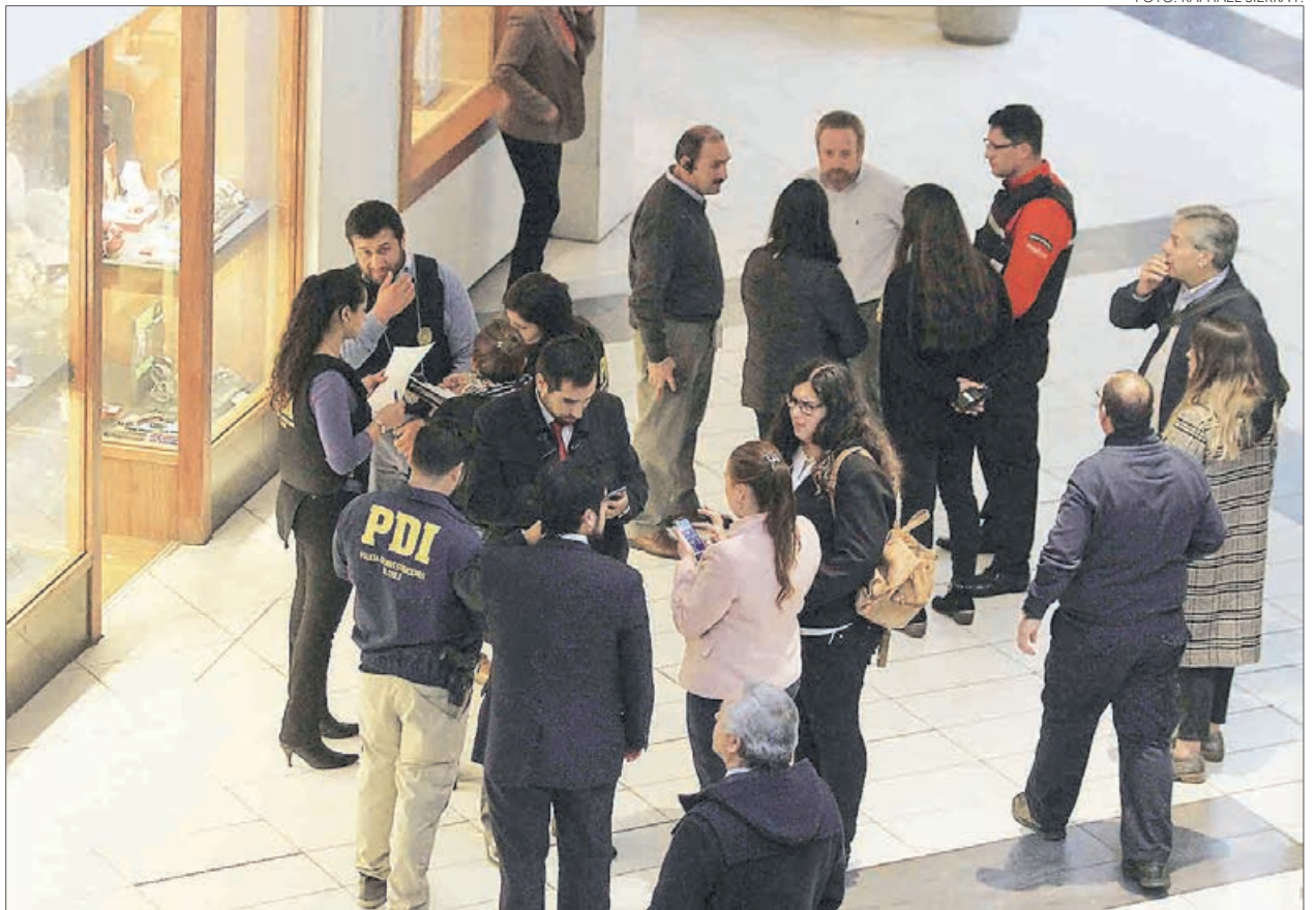
LA PDI REALIZÓ LOS PERITAJES en el recinto comercial.

Twitter @DiarioConce contacto@diarioconcepcion.cl