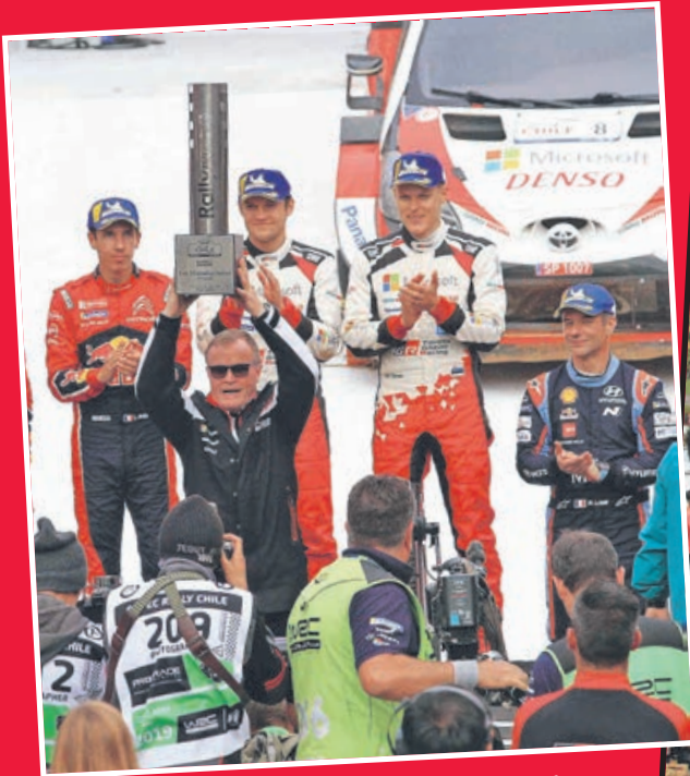
LA LEYENDA DEL RALLY Tommi Mäkinen, jefe fundador del Toyota WRT, celebró como un piloto más la victoria de su equipo las rutas del Bío Bío