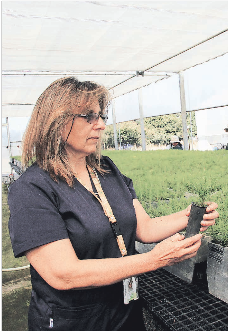
Corma y el medioambiente

El consumo de agua de los bosques plantados depende de muchos factores, tales como el clima, la localización, los ni-