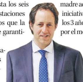
Cristóbal Urruticoechea Diputado RN por el distrito N° 21 Los Ángeles.

Y voy más allá, porque la ley debe tipificar la violencia como delito y penalizar, incluso con años de cárcel como propone el proyecto de ley que estoy impulsando en el Congreso. La iniciativa sanciona con presidio menor en su grado mínimo a medio el maltrato físico o de palabra durante el trabajo de parto o cuando la madre acaba de dar a luz. Es decir, de aprobarse la iniciativa las penas irían desde los 61 días, hasta los 3 años y 1 día de cárcel. Porque debemos velar por el motor de las familias del país.