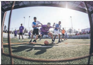
FOTO: RED BULL NEYMAR JR'S FIVE