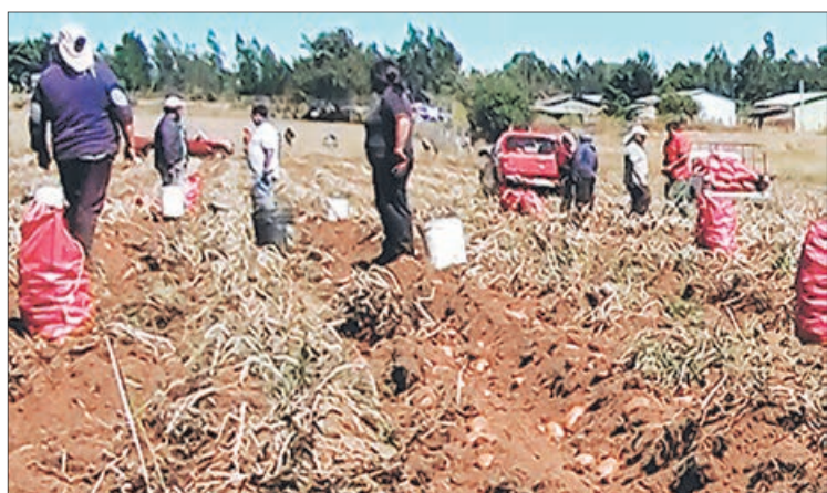
PRODUCTORES mejorarían rendimiento con apoyo del Inia.

Twitter @DiarioConce contacto@diarioconcepcion.cl