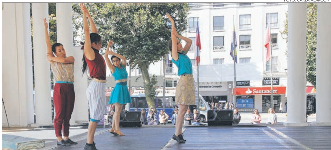
COMPañÍA ONE Piece mostró ayer un extracto de "Cerro arriba", proyecto apoyado por el Faicc 2018.

$37 millones entregará esta temporada la municipalidad de Concepción a través de esta convocatoria. Postulaciones se recibirán hasta el 30 de abril.