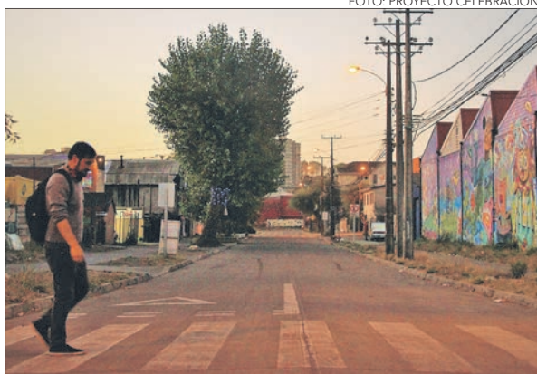
EL RECORRIDO pone en valor la memoria colectiva del antiguo cordón industrial penquista.

La novedosa propuesta repetirá funciones los días 25, 26 y 27 de abril.