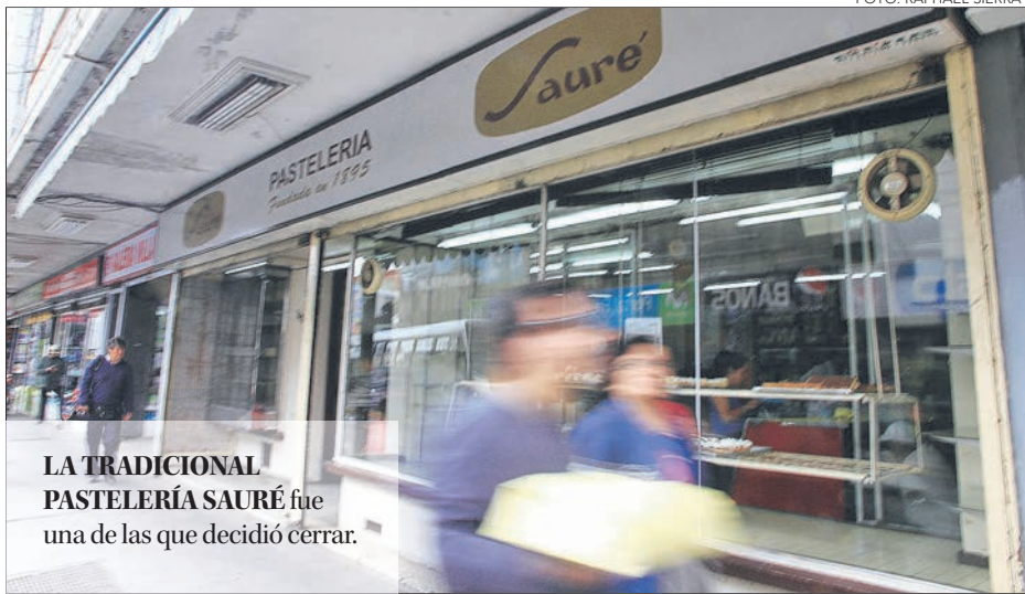
LA TRADICIONAL PASTELERÍA SAURÉ fue una de las que decidió cerrar.

Una de las últimas compañías regionales que no pudo seguir fue Teknip, reconocida por su aporte en la innovación y desarrollo, sumándose a una lista de locales emblemáticos que han desistido en el último año.