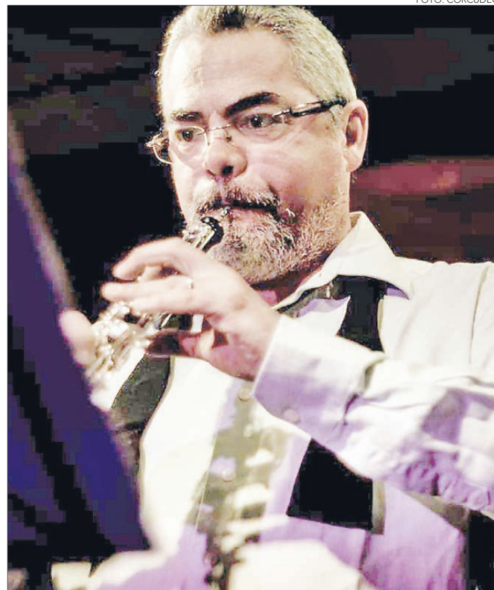
JAVIER BUSTOS interpretará la obra "La pasión según San Mateo", junto a la Sinfónica Nacional de Perú.