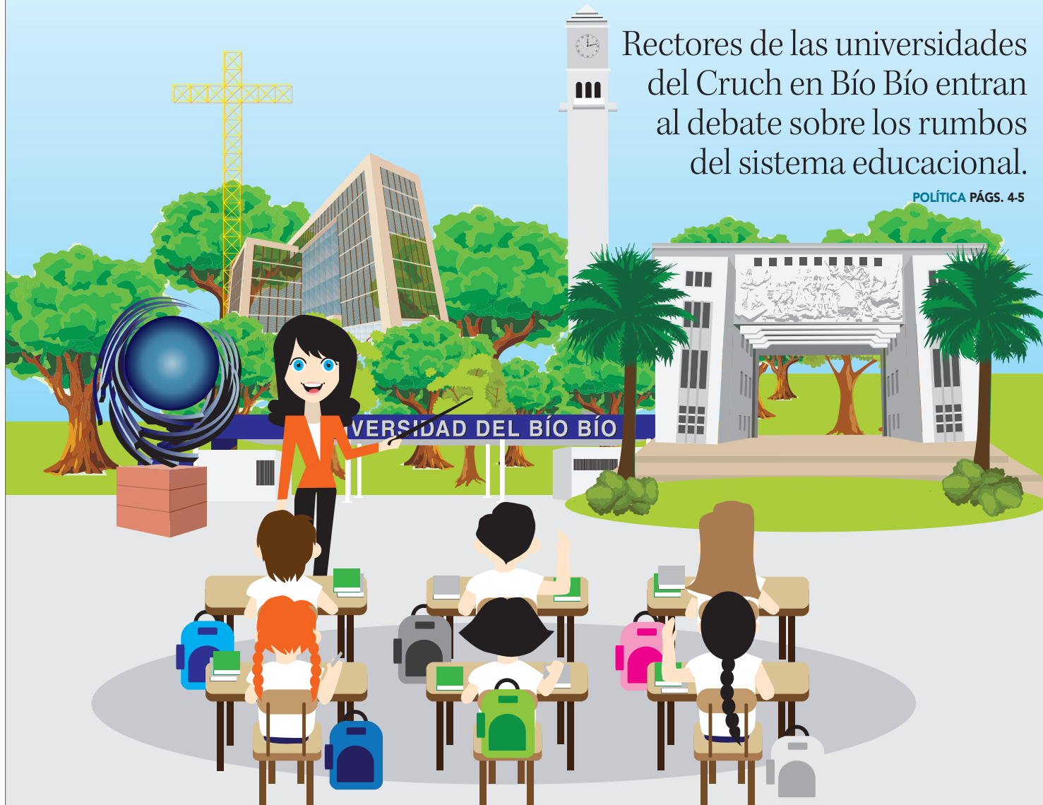
ILUSTRACIÓN: ANDRÉS OREÑA P.

EDITORIAL: LA INDISOLUBLE VINCULACIÓN DE LA UDEC CON SU ENTORNO SOCIAL