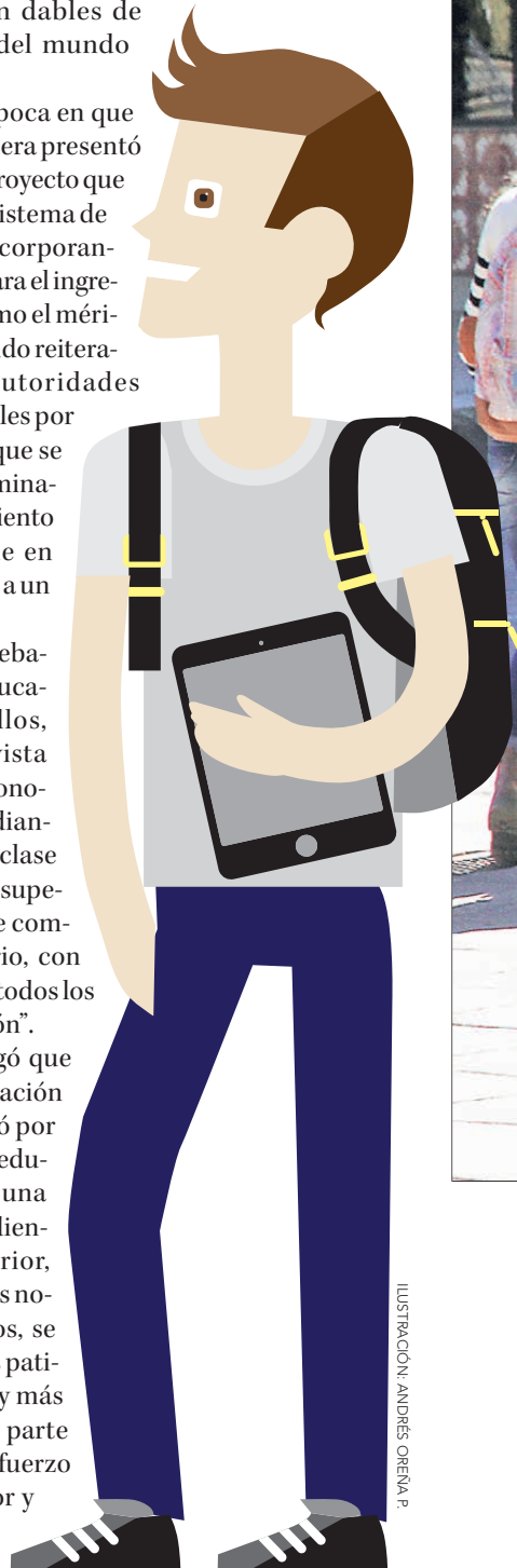
ILUSTRACIÓN: ANDRÉS OREÑA P.

A lo anterior, agregó que durante la administración Bachelet no se trabajó por la calidad de la de la educación. “Se trata de una tarea que quedó pendiente el Gobierno anterior, que no sólo lo decimos nosotros, lo dijeron ellos, se jugaron por quitar los patines a nuestros niños y más aún por invertir gran parte de los recursos y el esfuerzo en educación superior y no en educación escolar y parvularia,