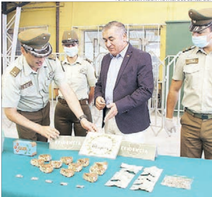
LOS QUEQUES contenían hojas de marihuana en su interior.