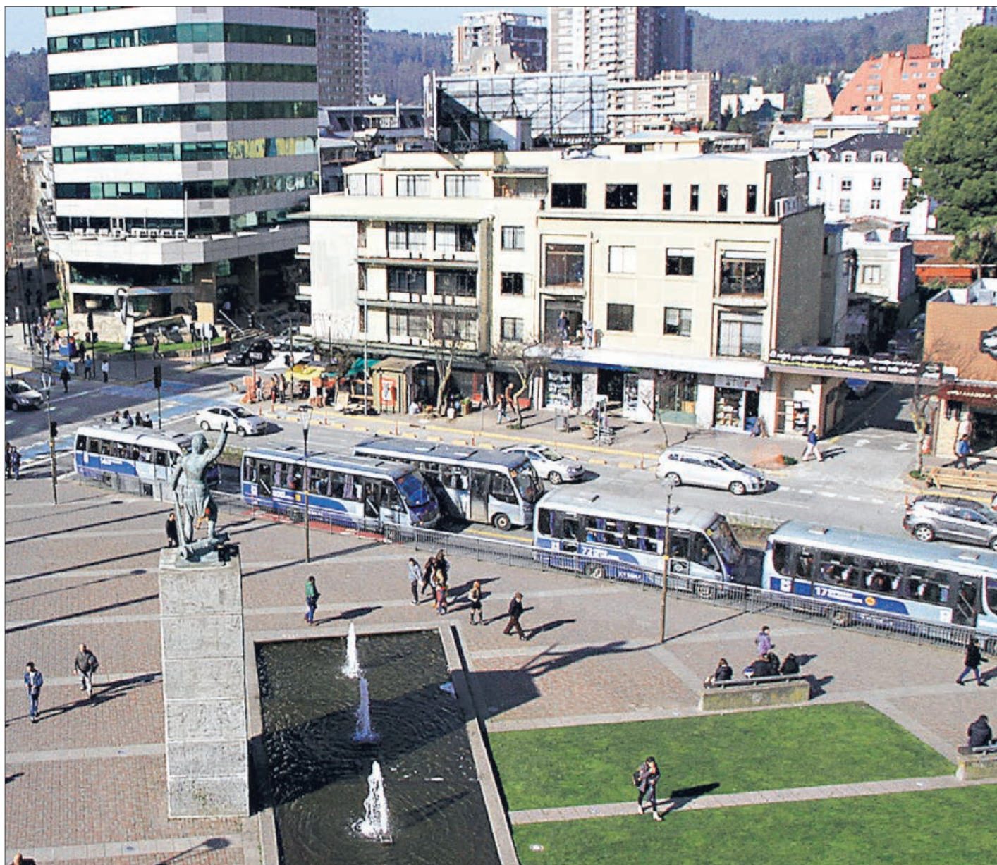
CONCEPCIÓN Y SU BUENA CONECTIVIDAD

Hacia Tomé la situación es bastante similar. Los buses atraviesan todo Concepción y retornan hasta la costera comuna por calle Chacabuco y el retorno es por la vía Penco.