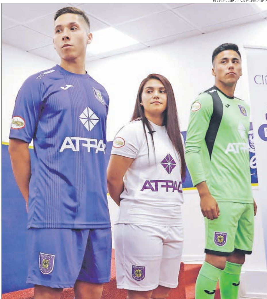
CLUB MORADO presentó sus uniformes de local, visitante y para el fútbol femenino.

es la fecha tentativa para el inicio del Campeonato de Tercera A.