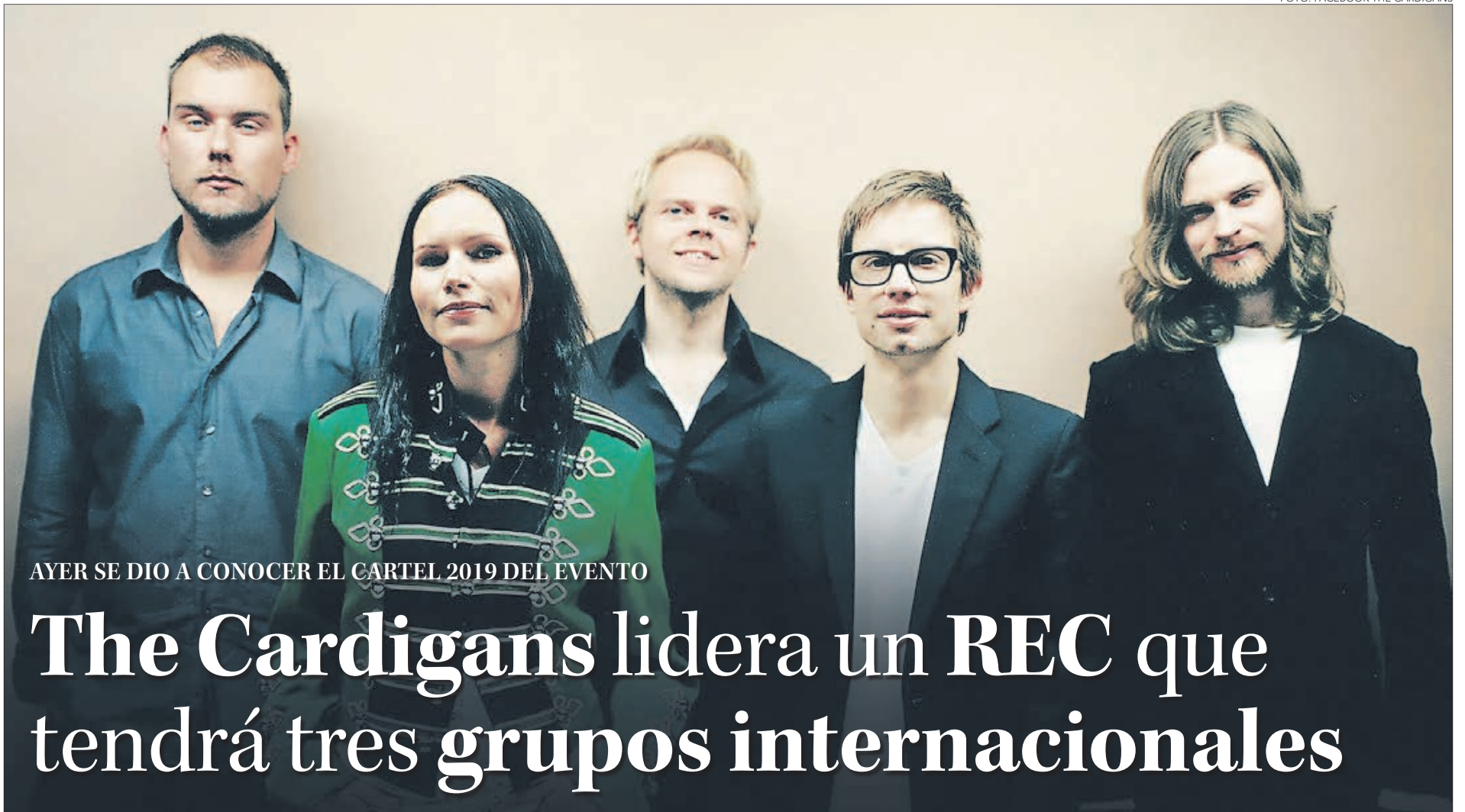
THE CARDIGANS

AYER SE DIO A CONOCER EL CARTEL 2019 DEL EVENTO