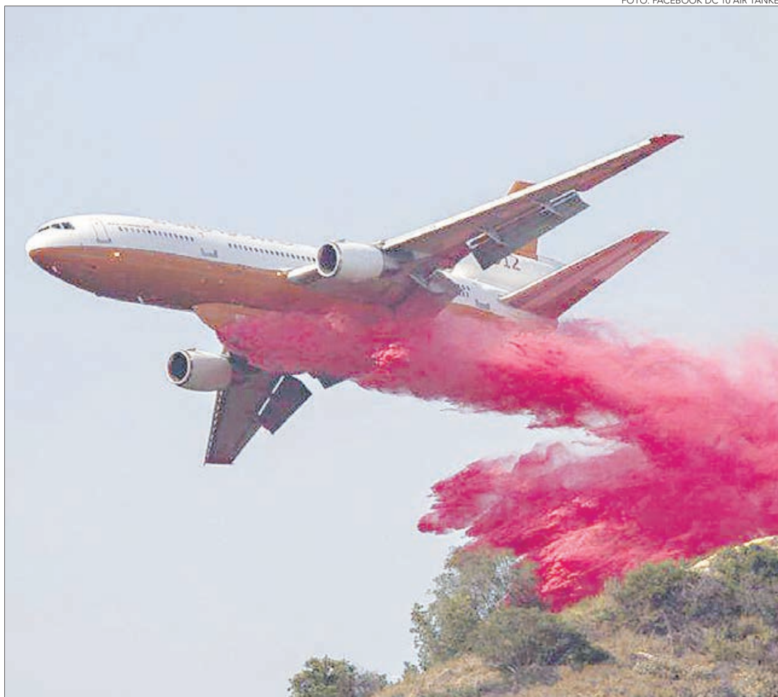
DC 10 AIR TANKER

Hasta el momento, el fuego ha consumido 3.341 hectáreas en la zona, 10% más que en la temporada anterior. Ya se contabilizan 1.334 siniestros.