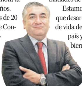
Robert Contreras Gobernador de Concepción

Como lo advertía nuestro Presidente, hace unos meses con los buenos resultados del Ima-