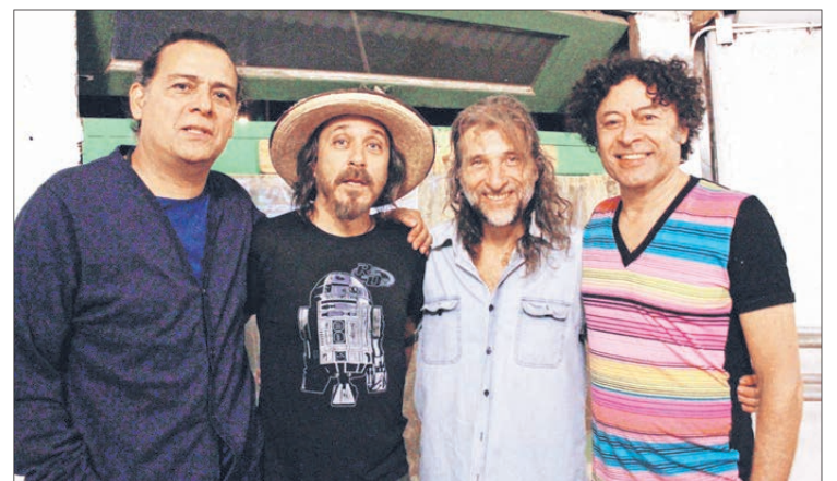
LA BANDA prepara material para un nuevo disco a lanzarse este año.

"Habrá temas de nuestro último disco lanzado en 2017 (homónimo) y temas clásicos como 'A mi ciudad' que ha sido un emblema