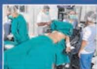
Pabellones de Práctica