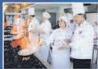
Taller de Gastronomía