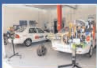
Taller de Mecánica