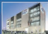
AIEP San Joaquín