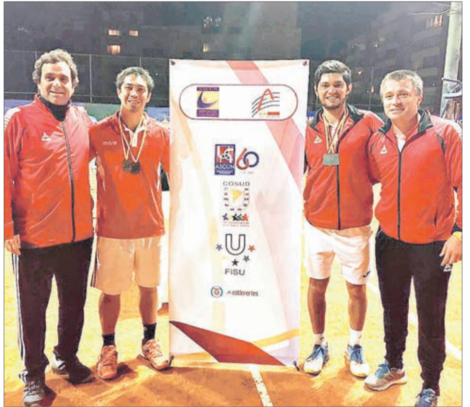
LOS JUEGOS Suramericanos Universitarios se llevarán a cabo en Concepción, en abril próximo. Previamente, se realizaron en la ciudad en 2004.

Otros de los desafíos en cuanto a organización y también una de las grandes chances turísticas de 2019.