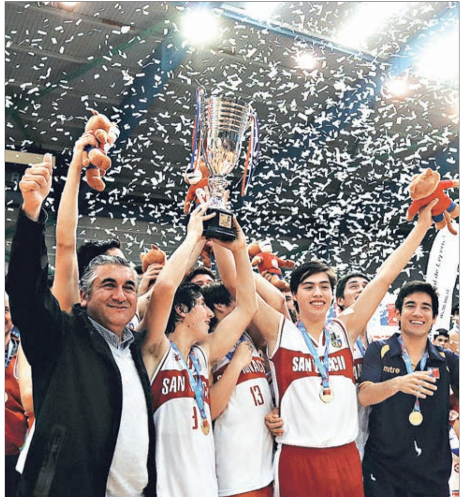
COLEGIO SAN IGNACIO en lo más alto del básquetbol escolar del país. Se quedaron con la copa tras vencer 71-60 a Los Lagos en una apasionante final en Huachipato.