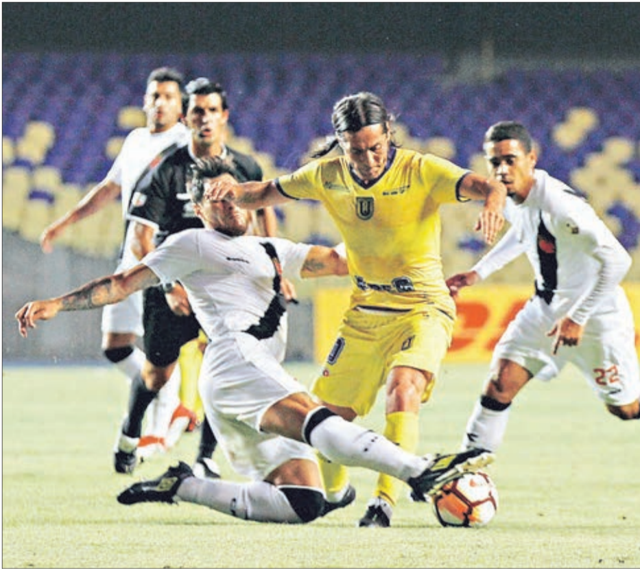
LA UDEC VA POR su revancha en la Libertadores. Tras quedar eliminado en la fase previa con Vasco da Gama en 2018, ahora estará en el Grupo C la próxima temporada.