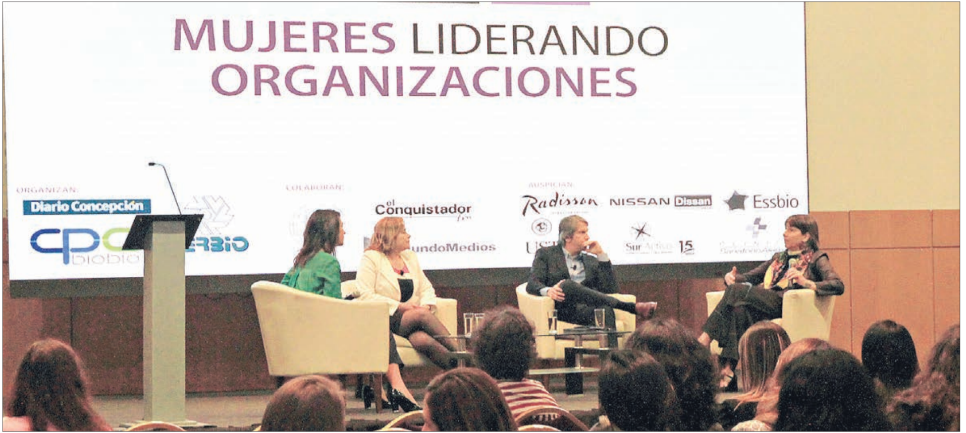
ORGANIZADO POR DIARIO CONCEPCIÓN, CPC BÍO BÍO Y FERBIO