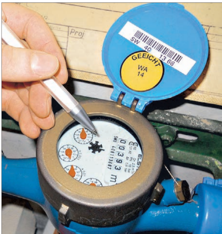
LA INTERVENCIÓN DE MEDIDORES es una de las prácticas más habituales, junto con la creación de conexiones ilegales

sanciona cualquier tipo de intervención en su sistema de agua potable o aguas servidas, es un delito, lo que implica, entre otras cosas, asumir los costos de reposición.