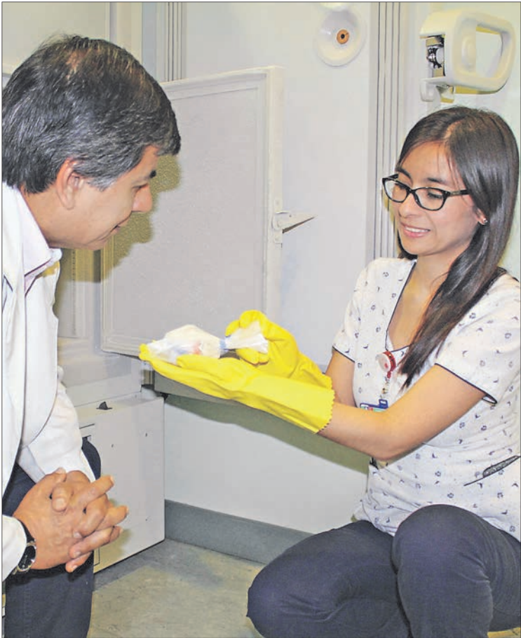
LOS TEJIDOS son almacenados en Las Higueras para estrictas medidas de seguridad y congelación.

OPINIONES Twitter @DiarioConcepcion contacto@diarioconcepcion.cl