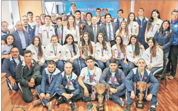
BUENA PARTE DEL GRUPO que fue reconocido ayer, estarán en la versión 2019 de los Juegos de la Araucanía.