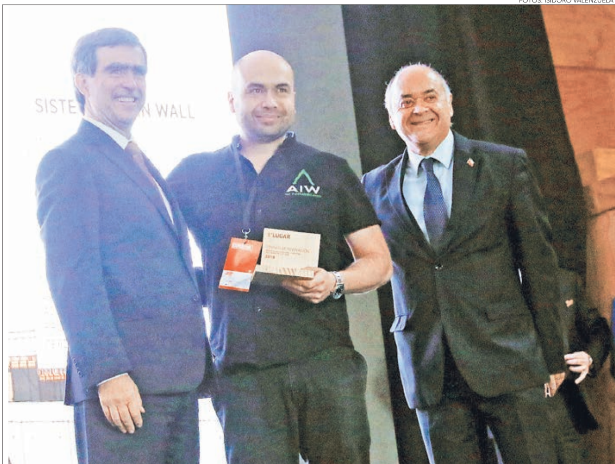
SACÓ EL PRIMER LUGAR DEL TORNEO DE INNOVACIÓN EN MADERA COMAD 2018

- Con el aumento de la calidad, lo que estamos haciendo es poder llegar a garantizar en el mercado inmobiliario el excelente estándar de los paneles de