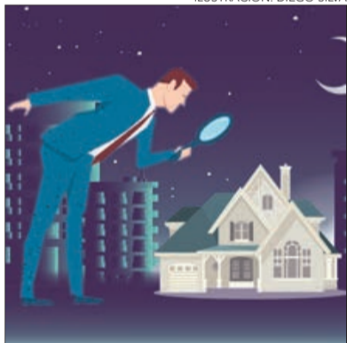
ILUSTRACIÓN: DIEGO SILVA