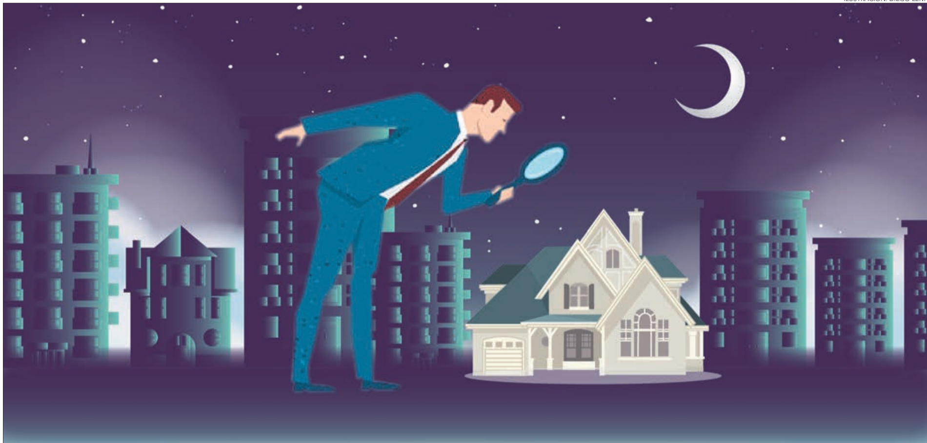
ILUSTRACIÓN: DIEGO LEIVA

TENDENCIA EN ALZA COMO FORMA DE AUMENTAR LAS JUBILACIONES