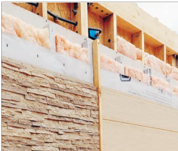
LAS INSTALACIONES se conectan como un sistema Plug and Play que ya están estandarizados en todos los paneles.

como un Dock , como en el interior de todos y cada uno de los paneles por lo que sólo se hace un remate en obra de las terminaciones que ya vienen de fábrica y, por la parte exterior, se conectan los sistemas eléctricos y de agua.