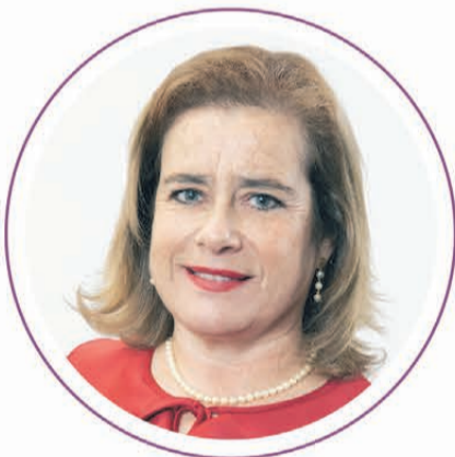
Flor Weisse Presidenta Consejo Regional Bío Bío