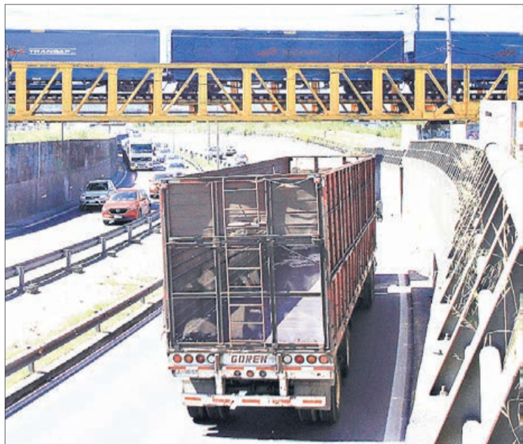
EL COLAPSO VIAL sólo se superó pasado el mediodía.