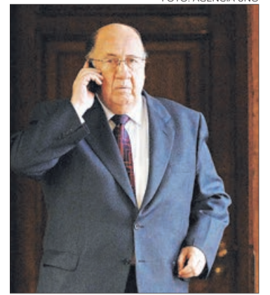
EL EX DIPUTADO desmintió una supuesta asesoría.

En resumen, Diario Concepción desea rectificar la interpretación equivocada del titular y ofrece sus disculpas a quienes pudieran sentirse afectados por la misma.