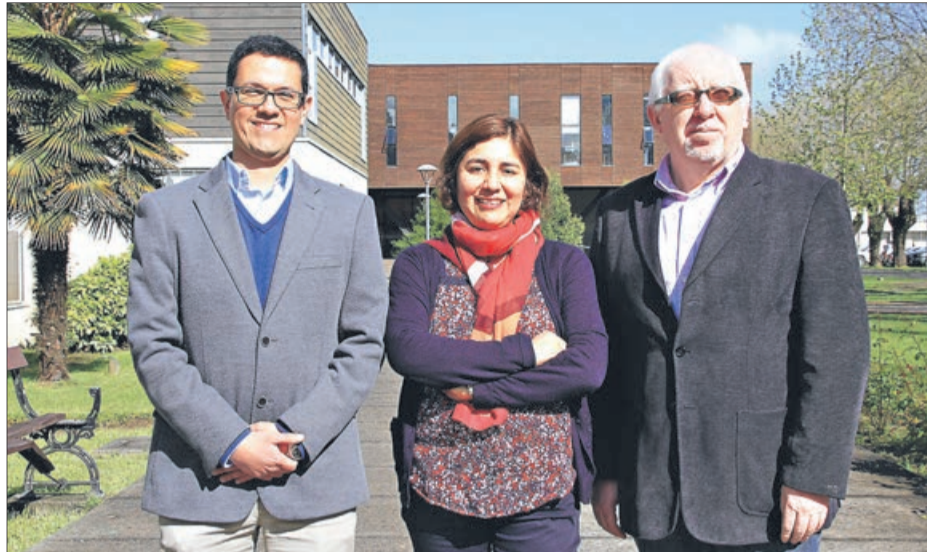
POSTGRADOS DE LA FACULTAD DE CIENCIAS EMPRESARIALES UBB

El programa en Ciencias de la Computación nació en el año 2009 y es un Magíster de carácter académico orientado a los alumnos de la carrera de Ingeniería Civil Informática y a profesionales del área de las ciencias de la computación que quieren actualizar sus conocimientos. "Estamos insertos en un área que es muy di-