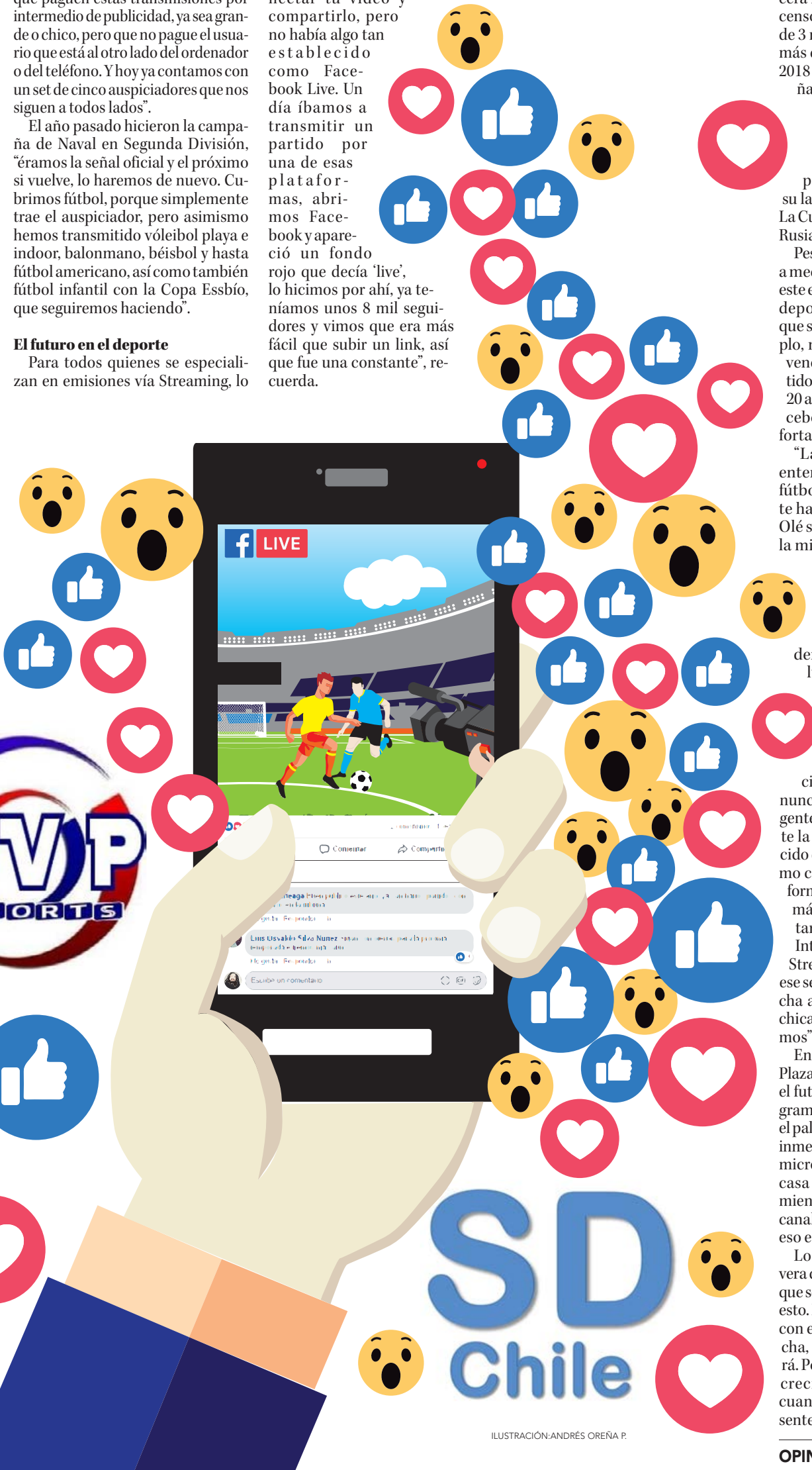
ILUSTRACIÓN: ANDRÉS OREÑA P.

Lo mismo advierte Guillermo Rivera de Tenis Chile, “claramente es lo que se viene, eso hace que sigamos en esto. Lo que está haciendo Facebook con el fútbol está abriendo una brecha, una puerta que ya no se cerrará. Por eso creemos que seguiremos creciendo y logrando cosas que cuando partimos no soñábamos”, sentencia.